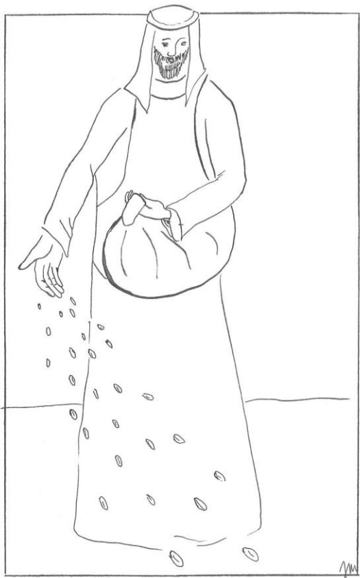
15. neděle v mezidobí cyklu A Mt 13,1-23