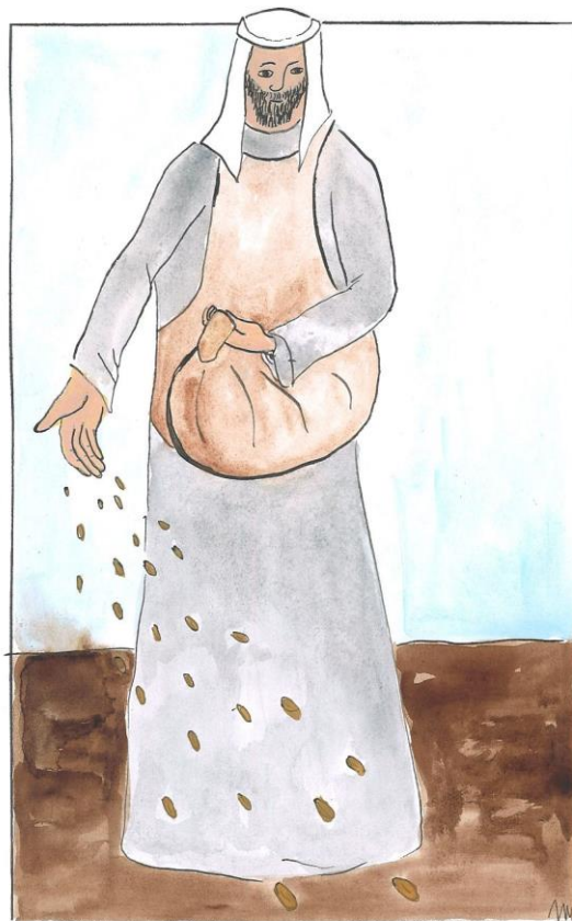
15. neděle v mezidobí cyklu A Mt 13,1-23