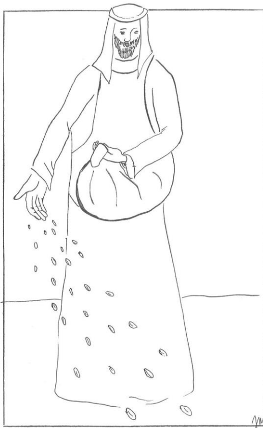
15. neděle v mezidobí cyklu A Mt 13,1-23